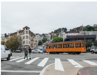
Khu Vực An Toàn Có Vạch Sơn