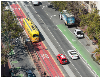
Các Làn Đường Dành Riêng Cho Muni