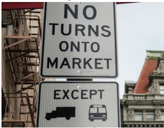
Hạn Chế Phương Tiện